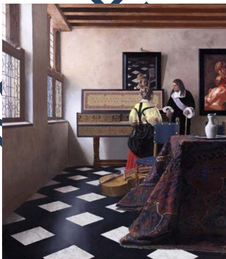
Imatge 5. Johannes Vermeer. "La lliçó de música" 1660, oli sobre llenç, 74,1 x 66,6 cm.