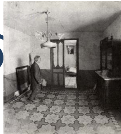
Imatge 4. Antonio López. "La casa de Antonio López Torres" 1972-75, llapis sobre paper, 82 x 68 cm