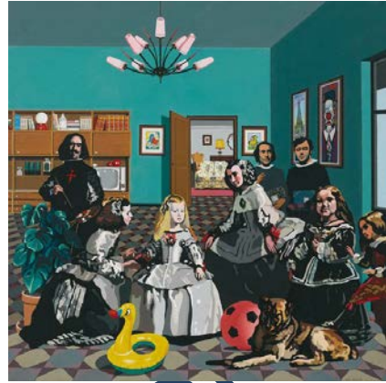
Imatge 2. Equip Crónica. "La salita" 1970, acrílic sobre llenç, 200 x 200 cm